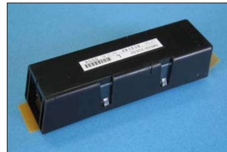
自動車用足元照明