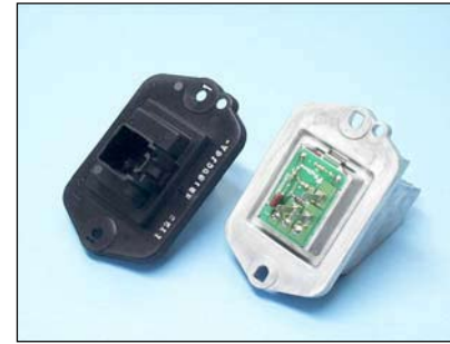
パワーMOS FETモジュール