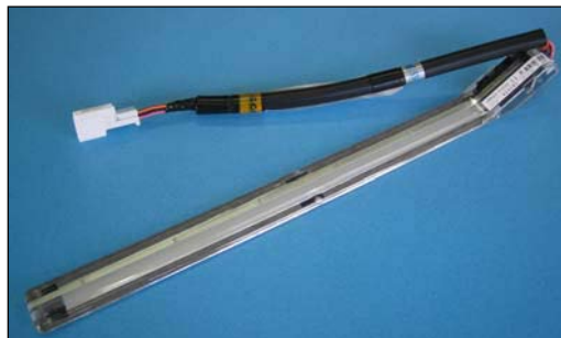
自動車用ドアポケットイルミネーション