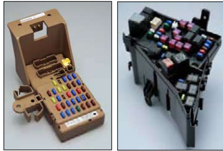
ジャンクションボックス・メインヒューズボックス